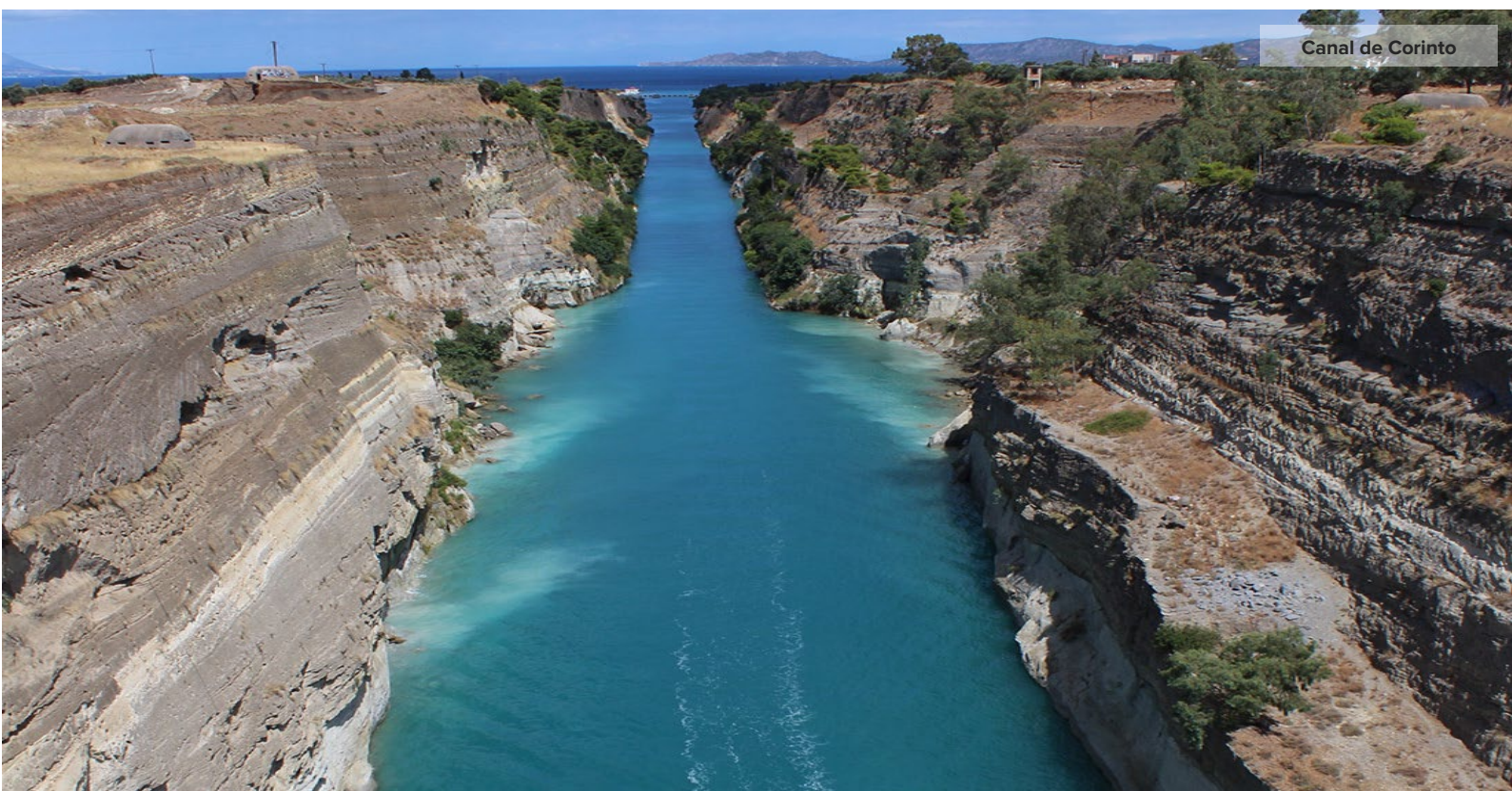
Canal de Corinto