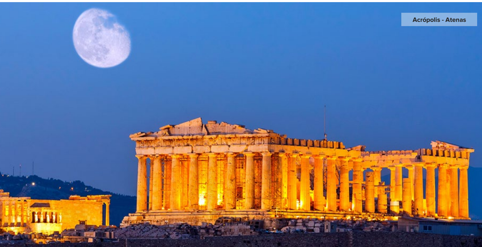
Acrópolis - Atenas

Nota: La estadía en el hotel no tiene incluido el impuesto de hospedaje de aprox. EUR 0,5 a EUR 4,0 por habitación por noche. Se abona directamente en el Hotel.